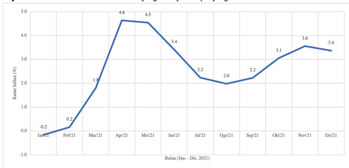
Rajah 2. Kadar inflasi bulanan Semenanjung Malaysia sepanjang tahun 2021

Secara ringkasnya dapat dirumuskan bahawa inflasi ini amat dipengaruhi oleh faktor harga bahan mentah di peringkat global; rantai bekalan domestik dan antarabangsa; perubahan cuaca dan iklim; serta polisi kerajaan terutamanya mengenai harga atau subsidi bahan api dan utiliti seperti elektrik.