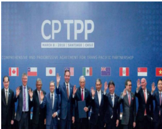
Rajah 2: 11 negara menandatangani CPTPP pada 8 Mac 2018 di Santiago, Chile.

CPTPP merupakan perjanjian daripada kesinambungan 3 TPPA yang telah ditambahbaik secara keseluruhannya. Perjanjian perdagangan bebas ini telah dibentuk dan dirunding semula oleh 11 negara selepas Amerika Syarikat di bawah pemerintahan Trump menarik diri daripada TPPA pada tahun 2017 ( CPTPP: Overview and Issues for Congress, 2022 ). Pada 8 Mac 2018 secara rasminya CPTPP ditandatangani oleh 11 negara tersebut.