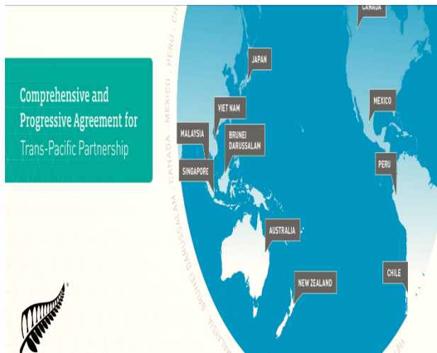
Rajah 1: 11 negara yang menyertai CPTPP

1 CPTPP adalah perjanjian perdagangan bebas yang dibentuk oleh 11 negara iaitu Australia, Brunei Darussalam, Canada, Chile, Japan, Malaysia, Mexico, New Zealand, Peru, Singapore dan Vietnam (CPTPP: Overview and Issues for Congress, 2022). Malaysia telah meratifikasi CPTPP disebabkan keadaan persekitaran ekonomi global yang tidak stabil dan perjanjian tersebut dikuatkuasa pada 29 November 2022. Bahkan, kerajaan baharu kali ini juga masih meneruskan CPTPP tanpa melakukan penilaian semula terhadap perjanjian tersebut.