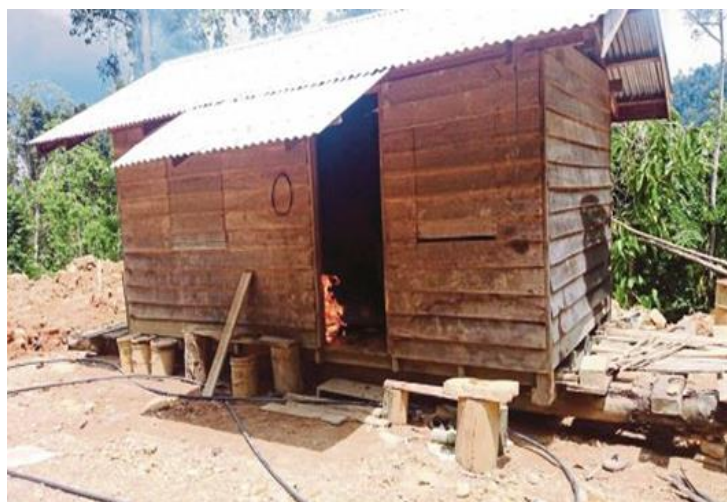
Rajah 2: Kem pembalakan haram di Sarawak

Sekiranya pembangunan yang dilakukan ini tidak terancang, maka ekosistem di kawasan tersebut akan musnah. Dalam keadaan negara kita pesat membangun sebagai salah satu lokasi tarikan pelancongan di rantau ini, keghairahan sesetengah pengusaha tempat pelancongan dalam menebang pokok di kawasan hutan tanpa kawalan adalah tidak menghairankan demi mengaut keuntungan yang berlipat kali ganda.