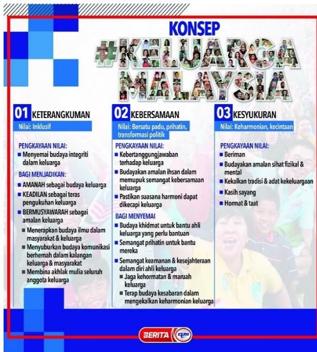
Rajah 1: Konsep Pelaksanaan Dasar Keluarga Malaysia

Dasar Keluarga Malaysia yang dibawa oleh Perdana Menteri bagi mengetengahkan nilai murni dalam sesebuah keluarga seperti toleransi, tolong-menolong, empati, kasih sayang menzahirkan betapa pentingnya sebuah keluarga yang sejahtera untuk membina sebuah negara bangsa (Nasruddin Mohamed, 2021). Selain itu, hala tuju kepada dasar ini iaitu rakyat mesti berganding bahu memulihkan negara tanpa mengira perbezaan politik, agama dan bangsa juga amat sesuai dalam menangani impak negatif COVID-19 khususnya impak dari aspek sosiobudaya.