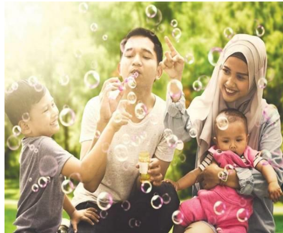
Rajah 1: Keluarga Komponen Terpenting

Mengikut Kamus Dewan Bahasa dan Pustaka, keluarga bermaksud hubungan atau pertalian antara seseorang dengan seseorang yang lain sebagai anggota sesebuah keluarga. Tidak dinafikan, keluarga merupakan institusi sosial yang paling kecil namun ia mampu memberi sumbangan yang besar kepada pembinaan sebuah negara dan peradaban (Zaiton Mustafa, Roslan Nor, 2019).